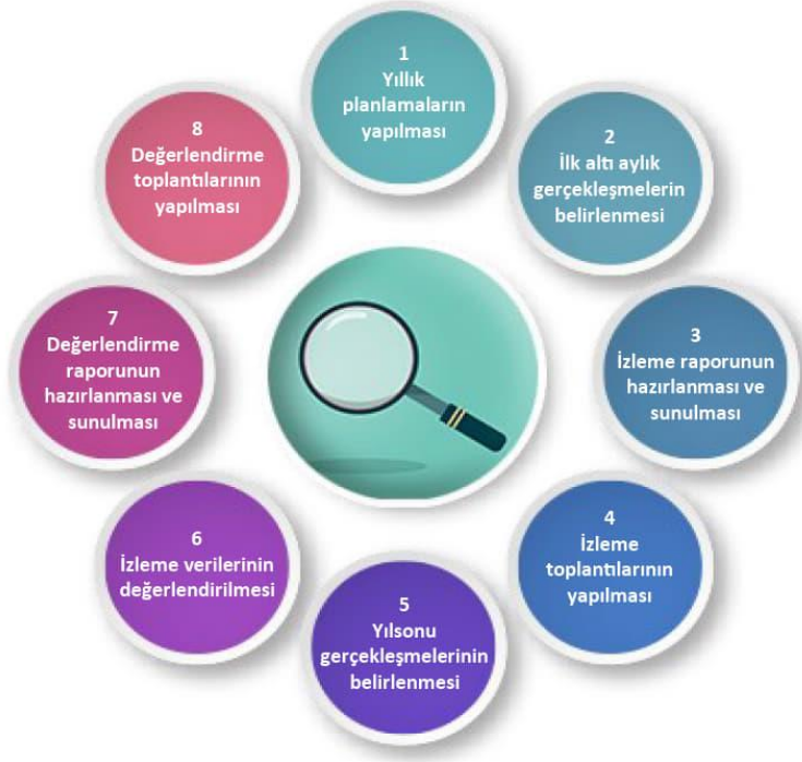
Şekil-4 İzleme ve Değerlendirme Süreci

İzleme ve değerlendirme sürecinin işleyişi ana hatları ile yukarıdaki şekilde özetlenmiştir.